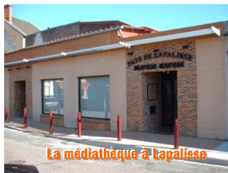
La médiathèque à Lapalisse

Les handicaps à lever, concernent l'évasion des actifs hors du pays et donc le développement de l'emploi local et la diversification de l'offre du parc résidentiel . Les équipements et services diffus en milieu rural, dont l'attractivité est menacée par la désertification rurale et son corollaire le déclin démographique, sont à conforter.