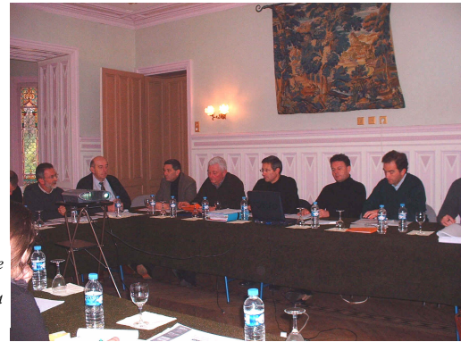
Séminaire du 4.12.2004

Le SCOT (Schéma de Cohérence Territoriale) est un document d'urbanisme qui à l'issue d'un diagnostic territorial, définit des orientations visant à rendre cohérents les projets d'aménagement du Pays de Lapalisse.