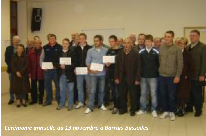
Cérémonie annuelle du 13 novembre à Barrais-Bussolles

Initialement, une bourse de 1.000 € était délivrée à l'obtention du