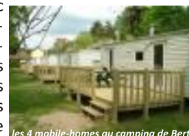
les 4 mobile-homes au camping de Bert

Au terme du contrat de location avec l'entreprise Les Halles Forziennes, la Communauté de Communes a décidé d'acquiescer gratuitement les 6 mobile-homes installés sur les campings communautaires de Bert et de Lapalisse, ces structures contribuant pleinement à l'attractivité de ces deux sites d'hébergement touristique.