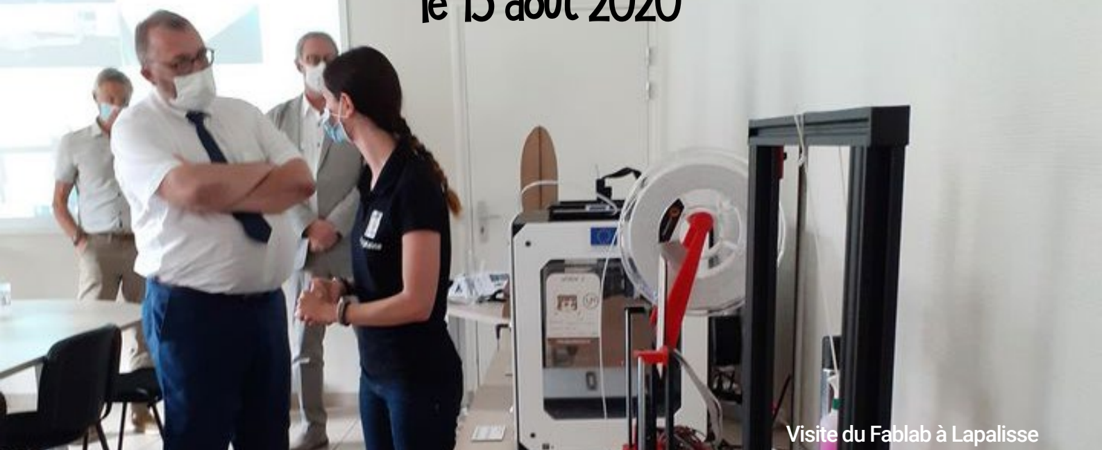
Visite du Fablab à Lapalisse