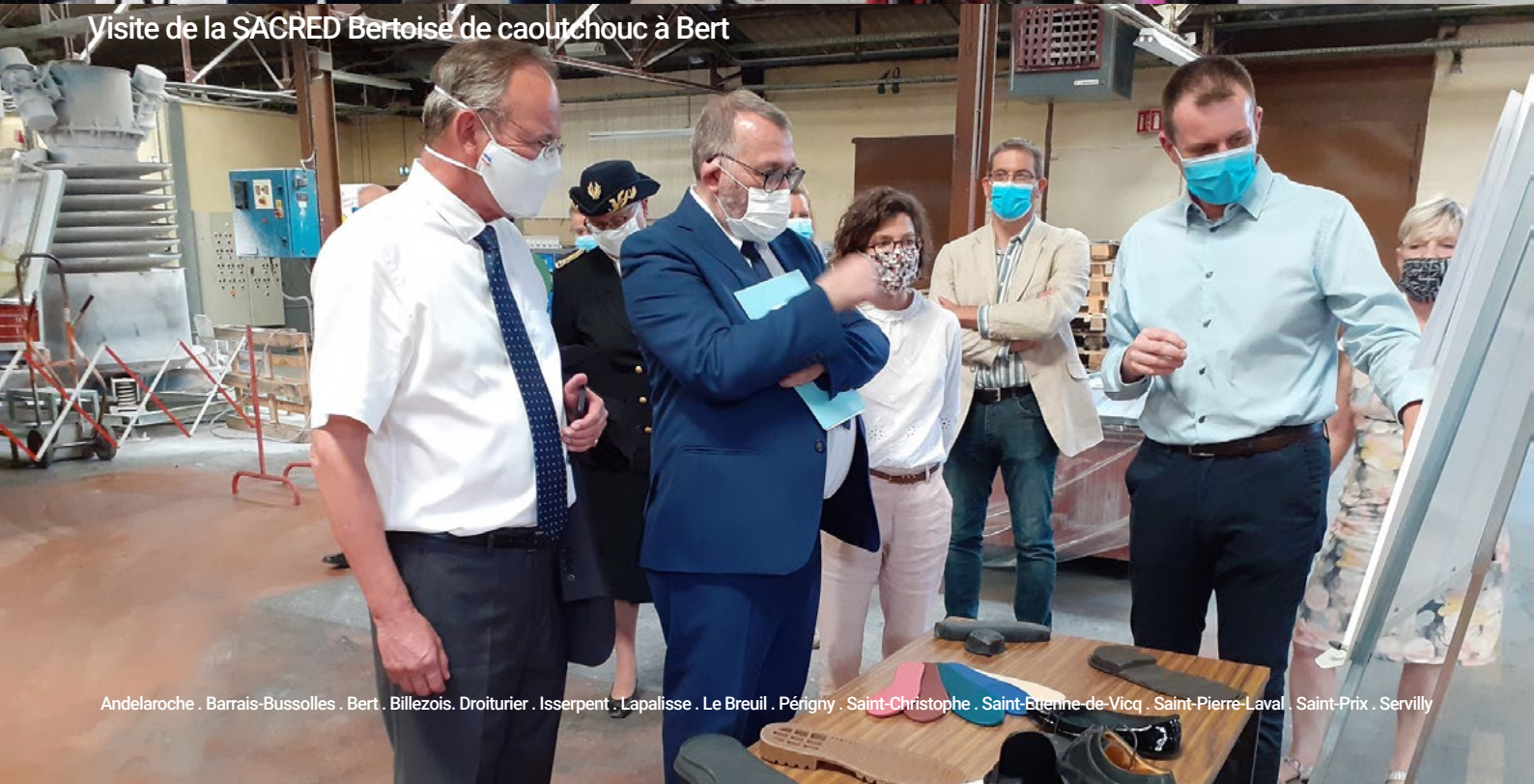
Visite de la SACRED Bertoise de caoutchouc à Bert